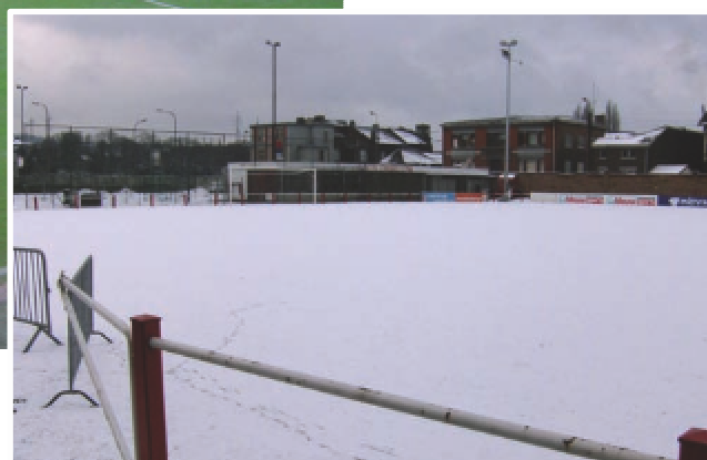
Terrain d'entraînement non chauffé, Situé à 100m du terrain principal Photo prise le 30/01/2010 à 12h00