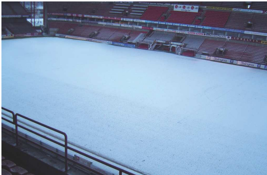
Terrain du Stade du Standard de Liège, chauffé par le système Thermalu® Photo prise le 30/01/2010 à 8h00