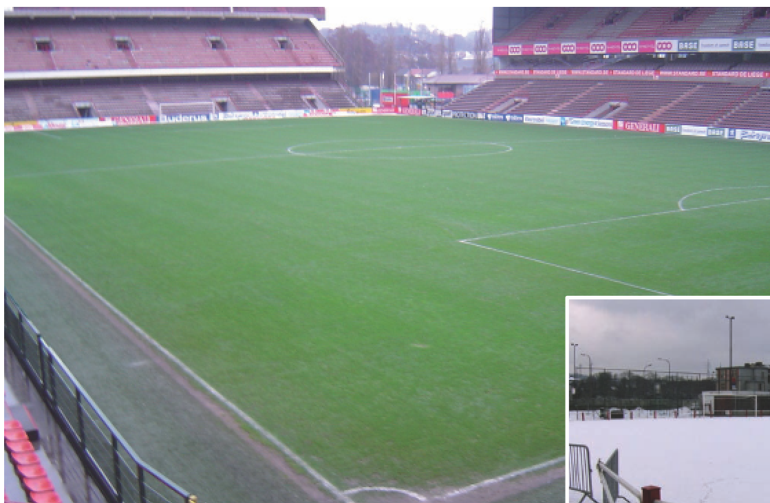
Terrain du Stade du Standard de Liège, chauffé par le système Thermalu® Photo prise le 30/01/2010 à 14h00 ( T° extérieure de -15° enregistrée pendant 15 jours )