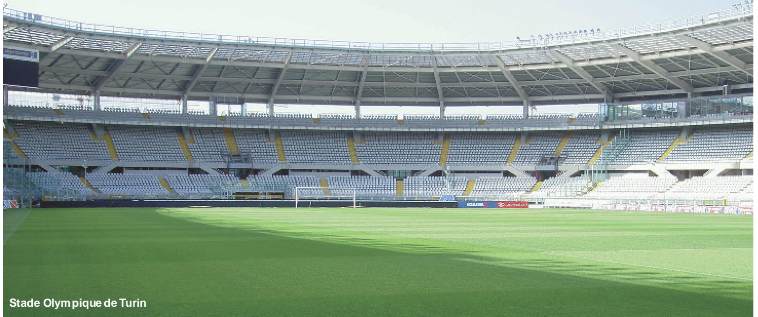
Stade Olympique de Turin